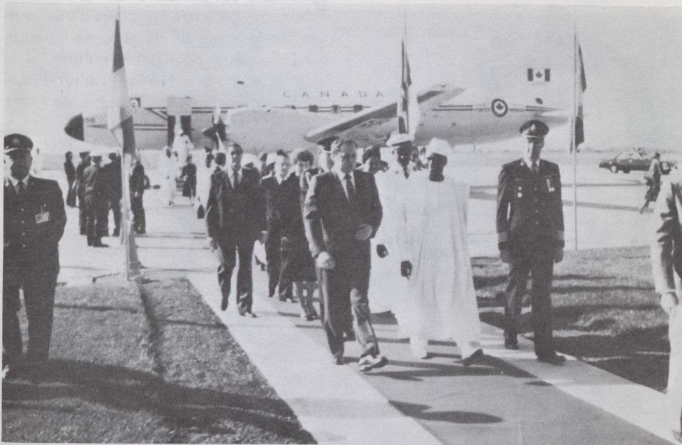
Le gouverneur général du Canada, M. Edward Schreyer (à gauche), a accueilli le président de la Guinée, M. Ahmed Sékou Touré, à sa descente d'avion à Ottawa.

La première visite au Canada du président de la Guinée, M. Ahmed Sékou Touré, a marqué une nouvelle et importante étape dans les relations entre la Guinée et le Canada.