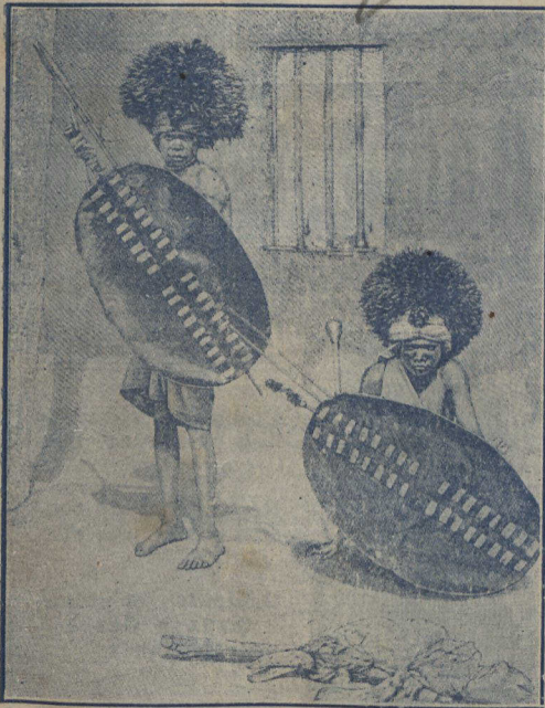
AU COEUR DE L'AFRIQUE