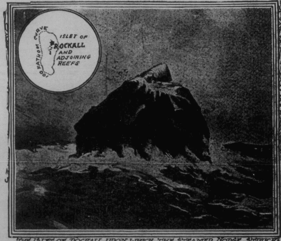
THE ISLET OF ROCKALL UPON WHICH THE STEAMER NORGE STRUCK