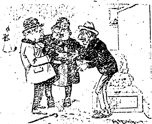
OFFICIER.—Payez et vous serez considéré, sinon gare au violon et vous n'aurez pas la fille de Jaco.