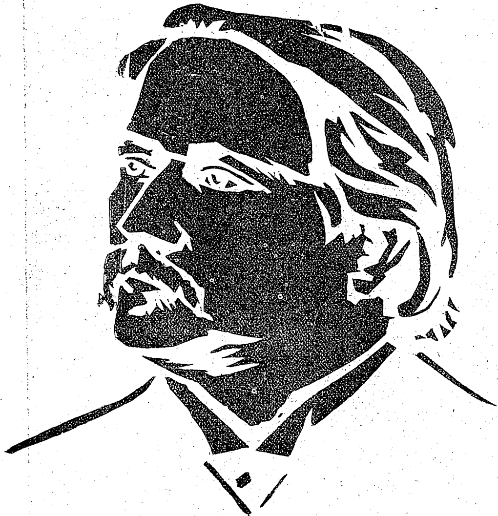
Jeu du Cyclo.—2ième Série.