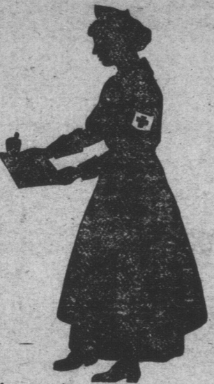
La garde malade de la Croix Rouge vous dit:

Servez vous de votre influence près de tous les buveurs L'Alcool en diminuant la résistance modérés que vous connaissez. Aidez à faire observer la loi de Prohibition.