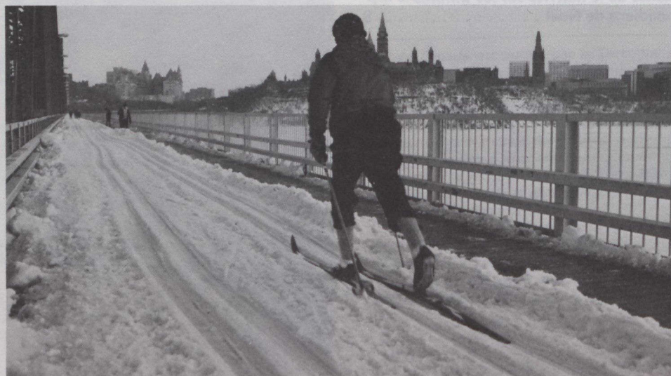
Un skieur à Ottawa, avec, au second plan à droite, les édifices du Parlement.

Montréal est l'une des rares villes du monde où l'on peut faire du ski dans la ville même. Son parc du Mont-Royal et celui de l'île Sainte-Hélène offrent leur merveilleux décor aux skieurs qui n'ont pas le temps de se rendre dans les stations de ski environnantes. On y fait aussi bien du ski alpin que du ski de fond. La ville est réputée pour son caractère cosmopolite, sa fine cuisine et sa vie nocturne. Une promenade dans le Vieux-Montréal est un retour au XVII e siècle, tandis que les (suite à la page 8)