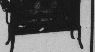
Poêle à l'huile automatique McClary

Boyaux pour arrosage en caoutchouc cordé de première qualité 1/2 pc. 18c. par pied 1/4 pc. 20c. par pied.