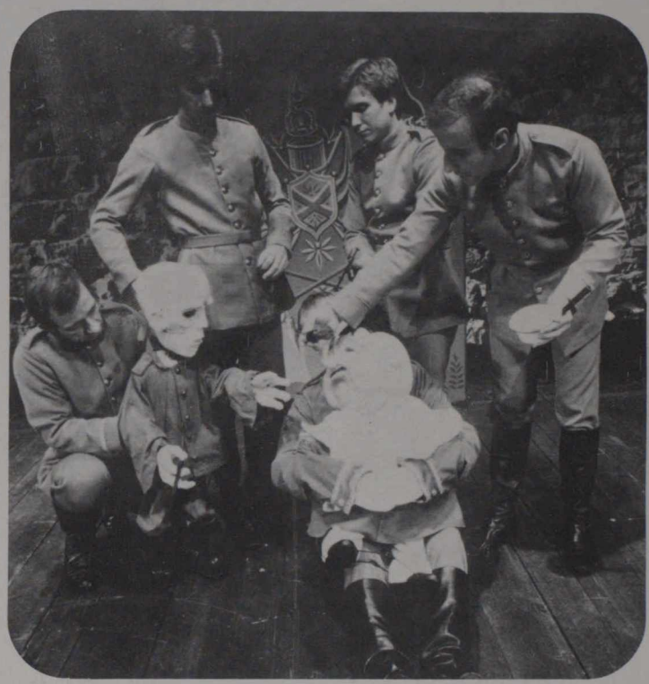
Woyzeck, producción del Centro Nacional de Artes

El concurso, que se lleva a cabo cada cuatro años, es patrocinado por el Ministerio Checoslovaco de Cultura y pretende ser un foro mundial para el diseño de producción teatral, escenografía y vestuario. Este año se presentó una exposición especial de títeres y marionetas para celebrar el Año Internacional del Niño. Canadá participó con el trabajo de Félix Mirbt además de siete otras compañías de títeres de todo Canadá.