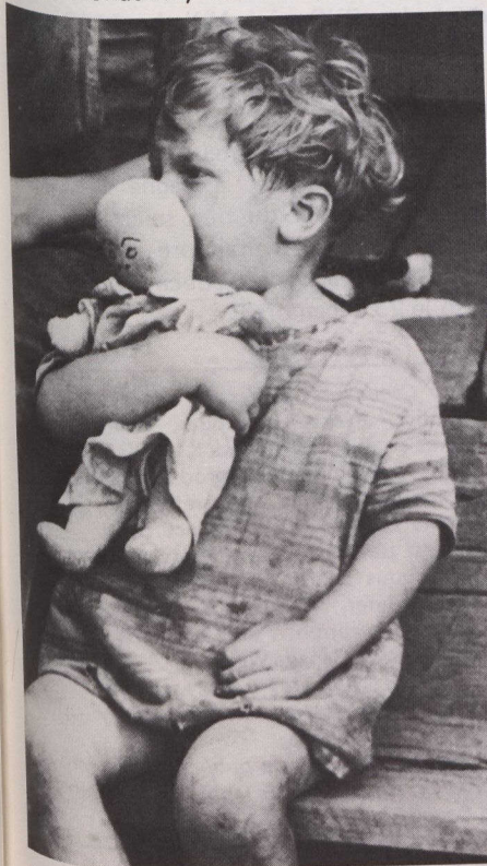
Un enfant dans le comté de Hale en Alabama (1936).