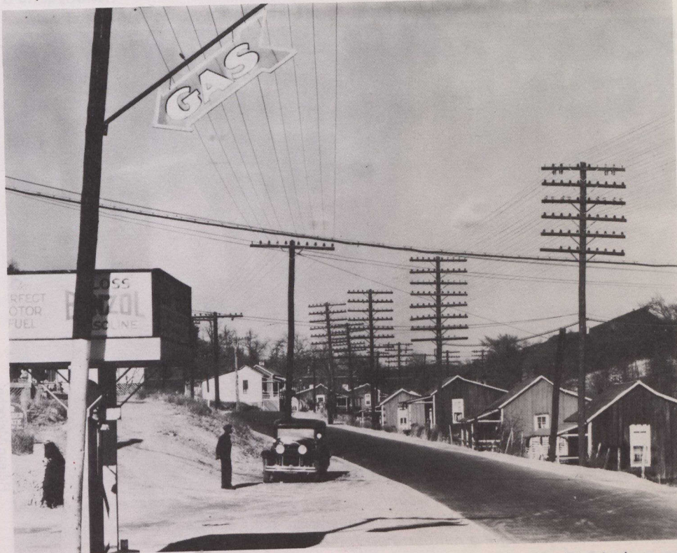
Des maisons de mineurs longeant une route dans les environs de Birmingham en Alabama (1935).