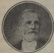
Le Président Loubet