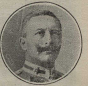
S. M. Guillaume II