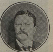
Le Prés. Roosevelt