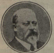
S. M. Edouard VII