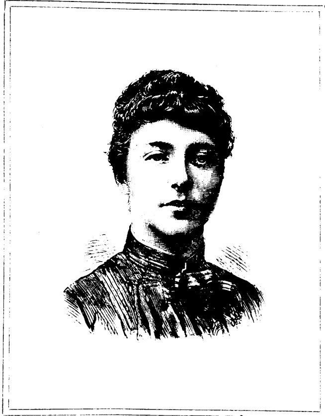
S. A. LA PRINCESSE MARIE D'ORLÉANS

ABONNEMENTS : Six mois : $1.50. — Un an : $3.00