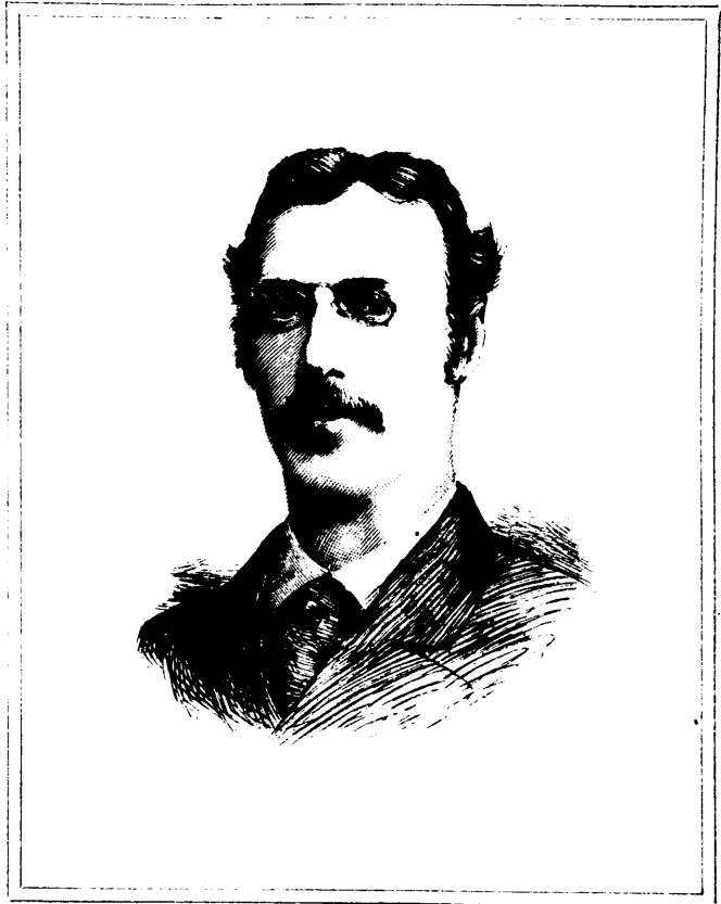
S. A. LE PRINCE WILDEMAR, DE DANEMARK