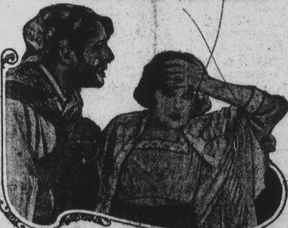
NORMA TALMADGE in 'THE PASSION FLOWER'