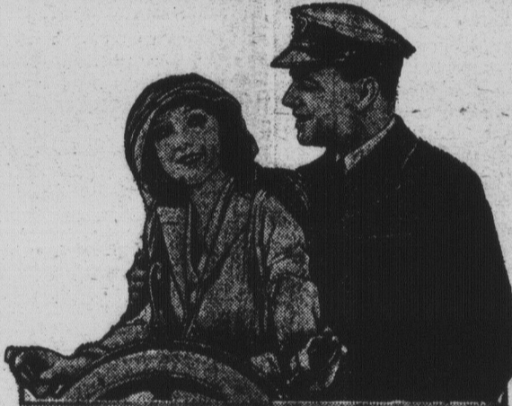
Douglas MacLean and Madge Bellamy in 'The Hottentot'