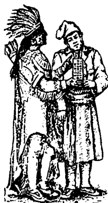
MARQUE DE COMMERCE.

Voulez-vous ne plus tousser? Faites usage de l' Elixir Resineux Pectoral , le grand remède du jour contre la TOUX, le RHUME et autres affections de la Gorge et des Pouxmons. De nombreux certificats émanant de citoyens éminents, de membres du clergé, de communautés religieuses, de médecins distingués attestent l'efficacité merveilleuse de cette préparation. A défaut d'espace nous ne donnons que le certificat suivant: