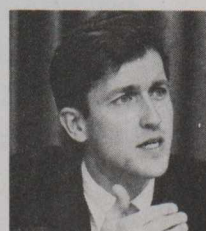
Svend J. Robinson Néo-démocrate Burnaby, (B.C.)