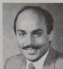
John V. Nunziata Libéral York-Sud—Weston (Ont.)