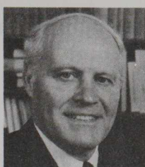
L'hon. Allan Lawrence Progressiste conservateur Durham—Northumberland (Ont.)