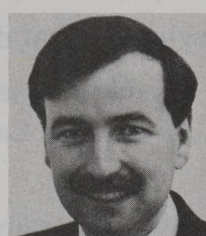
Rob Nicholson Progressiste conservateur Niagara Falls (Ont.) VICE-PRÉSIDENT