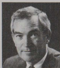
L'hon. Robert Kaplan Libéral York-Centre (Ont.)