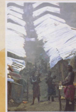
Camp de réfugiés en Sierra Leone