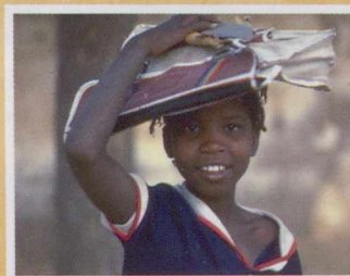
Jeune étudiant au Niger