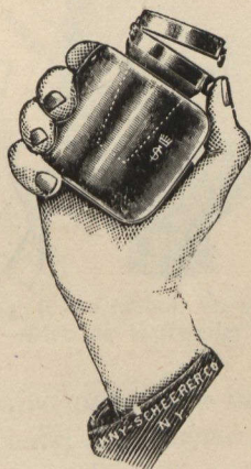
Fig. 2. — Crachoir en nickel imaginé par le Dr. Knopf. Facile à mettre en poche et à manier avec une seule main.

être sans couvert. Il a été démontré que les mouches et autres insectes qui ont accès à l'expectoration tuberculeuse, deviennent ainsi les propagateurs de la maladie.