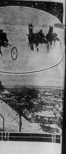
Le cheval au traîneau.

Mardi, le 9. — Soirée au club de ski "Loyola".