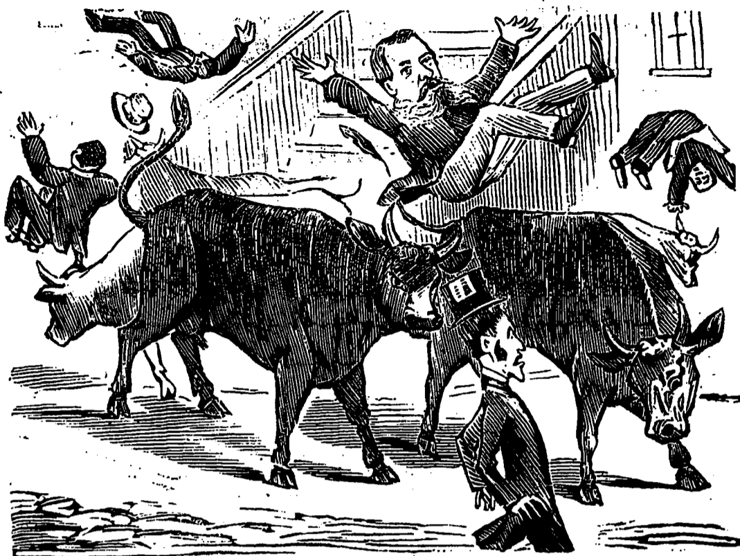
AVEC LES SOUHAITS LES PLUS SINCÈRES DU CANARD.

MARDI LES IMPRIMEURS CANADIENS DONNENT LEUR EXCURSION AU CLAIR DE LA LUNE Avec le concours de la BANDE DE LA CITE DANSE A BORD BILLETS: Messieurs, 50 cts. Dames, 25 cts. Départ à 8 heures p. m. précises du quai du traversier de l'île Ste Hélène. N'OUBLIEZ PAS LA DATE MARDI, 21 COURANT