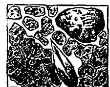
Fig. 3.—Terre peu ameublie.

Exemple de semence manquant d'air. —La fig. 3 représente un grain d'avoine semé dans une terre rocheuse, peu ameublie. L'air y est indiqué par les espaces en blanc, l'eau par les points noirs. Il est évident qu'une semence ainsi placée manquera d'air, subira tous les changements atmosphériques, et sera exposée à périr de misère.