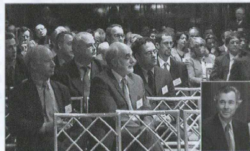
Public très motivé lors de la conférence sur l'étude KPMG à l'hôtel George V à Paris. En médaillon : le ministre du Commerce international, M. Pierre Pettigrew, à la conférence de presse.