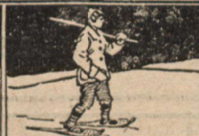
La Manière Cletrac

Avec des raquettes, il apparaît que le poids est distribué également sur une plus grande surface -- la manière Cletrac -- et l'homme glisse à la surface.