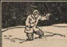
Ce n'est pas la manière Cletrac

Le pied qui supporte le poids de cet homme a une petite surface -- ce n'est pas la manière Cletrac -- de sorte que l'homme enfonce.