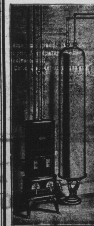
Chaudière Automatique McClary pour l'eau

Nous avons aussi une très belle ligne d'outils pour menuisier à des prix qui vous étonneront.