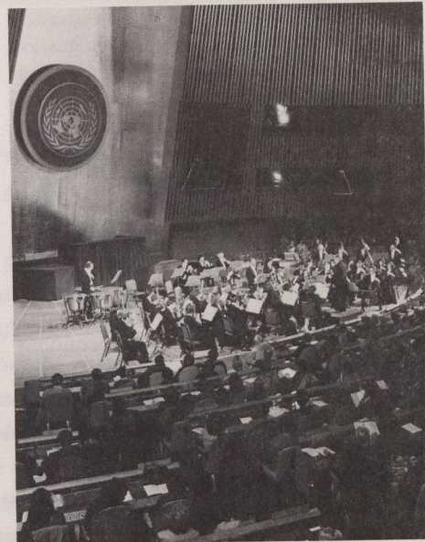
L'Orchestre du Centre national des arts donnant un concert aux Nations Unies.

Deux jours plus tard, l'Orchestre du CNA a donné un autre concert à New York, au Carnegie Hall. Il a interprété la version-concert de l'opéra de Christoph