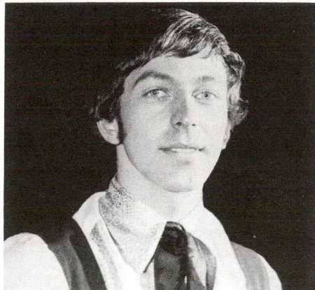
Toller Cranston de Toronto, champion des compétitions en solo pour hommes au tournoi "Skate Canada", s'est classé premier dans le patinage libre. Il espère pouvoir participer aux Jeux olympiques de Montréal en 1976.

"Skate Canada 73" qui constitue la première compétition annuelle comman-