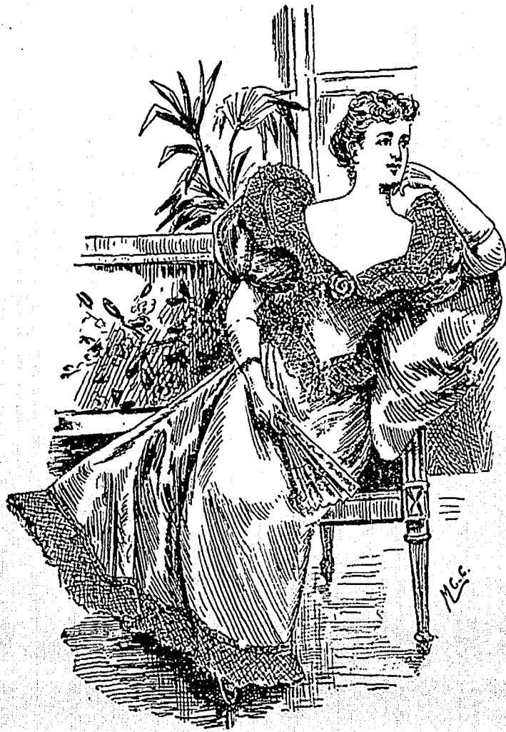
TOILETTE DE SOIRÉE

Et, pour terminer, j'ajouterai une nouveauté qui intéressera encore infiniment la jeunesse dorée. Le bouquet des demoiselles d'honneur devient un objet d'un prix inestimable si l'on peut se mettre à la hauteur de la mode actuelle. Il est offert dans un cornet de satin blanc, entouré d'une véritable dentelle disposée en garniture de mouchoir, sans couture par conséquent. Le mouchoir entier s'offre même drapé autour des fleurs,