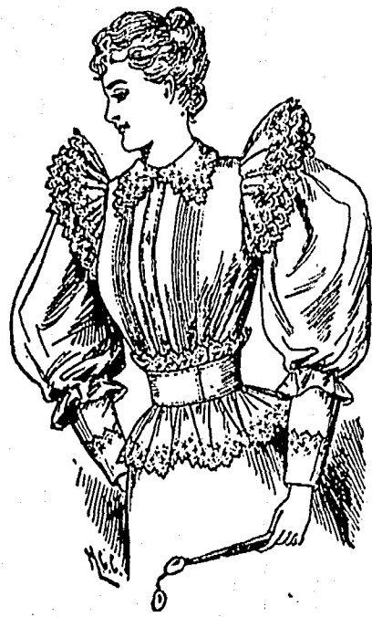
BLOUSE NO 3

de sorte que la jeune fille aussi gâtée a double plaisir en recevant son bouquet et possède ainsi un souvenir constant du mariage de son amie.