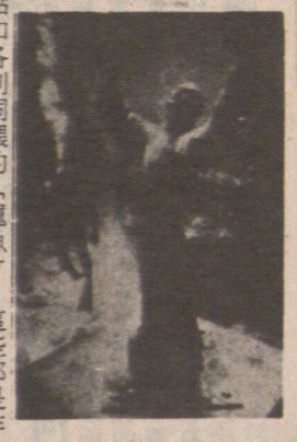
(一) 加尼羅德 (CARVOROD REEF) 海底公園附近，有一處名為「羅萬」的勝蹟。

在彭亨海底公園附近，有一處名為「羅萬」的勝蹟。這是一處由自然力量形成的「羅萬」勝蹟。這是一處由自然力量形成的「羅萬」勝蹟。這是一處由自然力量形成的「羅萬」勝蹟。 羅萬勝蹟位於彭亨海底公園附近，這是一處由自然力量形成的「羅萬」勝蹟。這是一處由自然力量形成的「羅萬」勝蹟。這是一處由自然力量形成的「羅萬」勝蹟。 羅萬勝蹟位於彭亨海底公園附近，這是一處由自然力量形成的「羅萬」勝蹟。這是一處由自然力量形成的「羅萬」勝蹟。這是一處由自然力量形成的「羅萬」勝蹟。