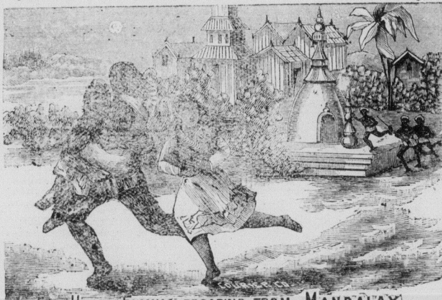
La remarquable famille velue du Roi Theebaw

La plus considérable et la plus riche entreprise d'amusements qu'il y ait sur la surface du globe