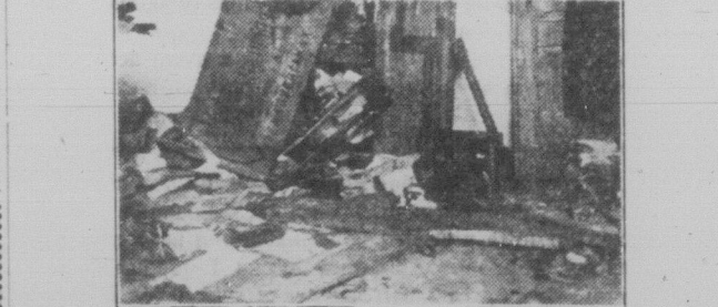
Кооператива "Спільна Праця" в селі Каладубиска, повіт Броди, злемодована польсько-фашистськими бандитами в часі "паніфікації" українських сіл.