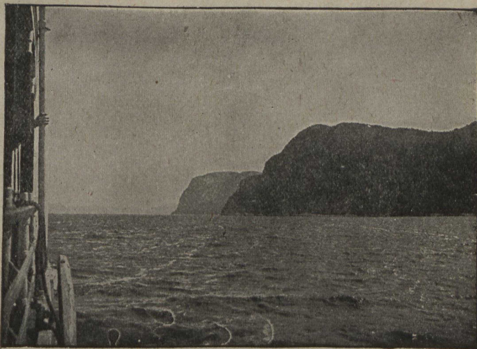
Vue du Cap Trinité prise à bord d'un vapeur sur la rivière Saguenay

Visitez les chutes du Niagara, Toronto, les Milles-Iles, Québec, et la merveilleuse rivière Saguenay qui coule au coeur des Laurentides.