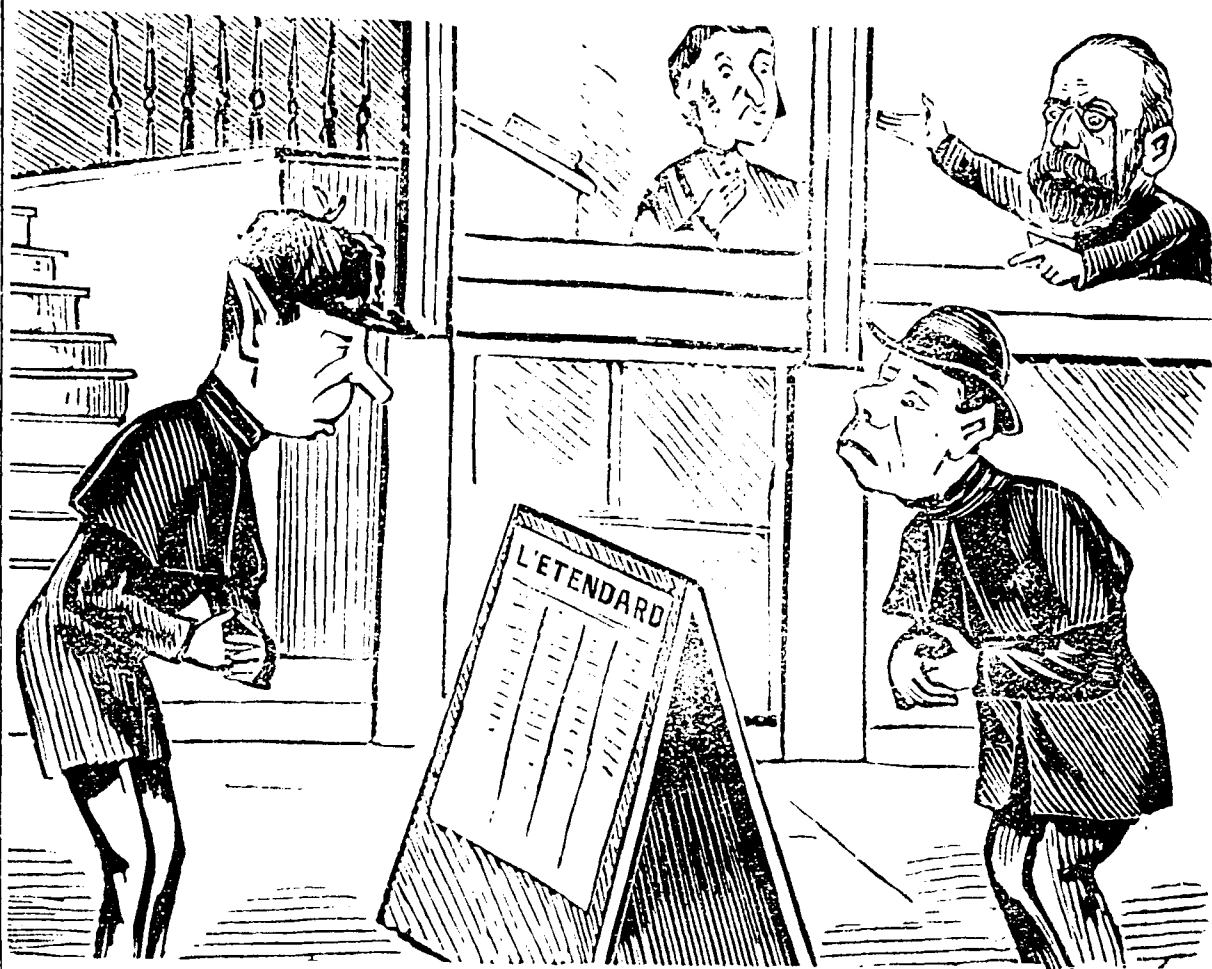
TEMPS: — 9 A. M. LIEU: DEVANT LES BURRAX DE L'ETENDARD LE GERANT (dans la fenêtre.) Voici des abonnés qui lisent le journal d'hier. Dépêchez-vous de coller le numéro d'aujourd'hui avant qu'ils aient lu deux fois l'Etendard d'hier.

Huitres du Golfe, Malpecques, Bouctou Chin, reçues tous les jours par l'Intercolombien. Chaque quart garanti. S'adresser à C. FOURNIER, Agent de la Compagnie du Richelieu et d'Ontario.