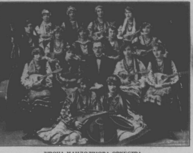
ДИВОЧА МАНДОЛІНОВА ОРХЕСТРА при Ц.В.К. ТУРФДім у Вінніпегу, одна з найстарших мандолінових оркестр ТУРФДім в Канаді. Тепер таких оркестр при відділах ТУРФДім є поперх 50.

не тому то на слідуочу неділю відбудеться аж два концерти: один рано, а другий вечером. Та й певний, що все одне буде тісно. Хіба-б до цього додати ще один концерт на вечір, тобто вечером два концерти: один від 7-ої до 9-ої години, а другий від 9-ої до 11-ої години. Присутний.