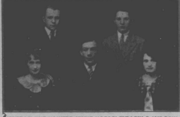
ЦЕНТРАЛЬНИЙ КОМПІТЕТ СЕКЦІЇ МОЛОДІ ТУРФДІМ В 1927 РОЦІ.

Бачучи загрозу другої війни, ми, робітничі молодь, повинні бути готові обороняти інтереси робітничої класи, а не капіталістичної. Бо на що ж вороги робітничої класи організують молодь у свої організації? На те, щоб виховати з них послужних манекенів, які на їх приказ пішли б за їх інтереси в огонь і воду. Щоби робітничі молодь могла боронити свої інтереси, вона має бути класово свідомою. А освідомлятися вона може лише при робітничій організації і читачи робітничої преси.