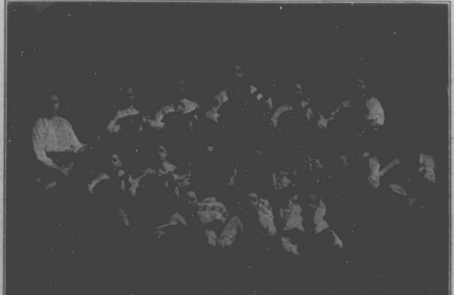
В неділю, 1. квітня, в годині 8:30 вечером торонтоський хор при відділі ТУРФДім та мандолінова оркестра з Торонта і Вест Торонта устроє прекрасний концерт, який буде цікавий тим, що оркестра і хор будуть співати і грати до радіо, яке буде встановлене в Укр. Роб. Домі. Товариші і товаришки на провінції повинні використати цю нагоду та послухати м'ялдіюної пісні та музики через радіо.