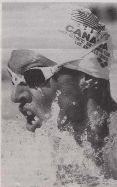
Alex Baumann obtuvo dos medallas de oro y batió dos récords olímpicos y mundiales para Canadá,