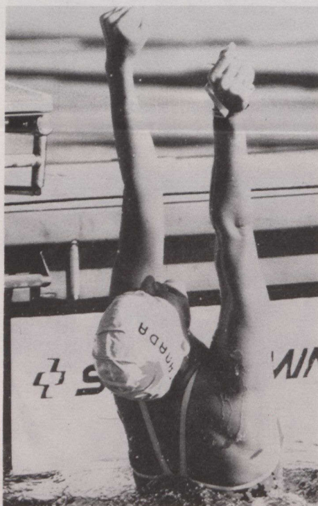
Anne Ottenbrite salta de gozo al ganar los 200-metros braza en 2:30.38, lo que le consiguió la medalla de oro.