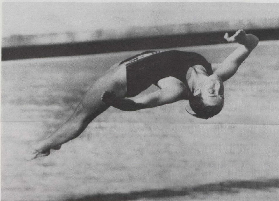
La medalla de oro de Sylvie Bernier muestra su forma perfecta en el salto de trampolín invertido de vuelta y media con medio giro. Fue la primera medalla de oro canadiense en las pruebas de clavado olímpico.

Para el final de la competición, Canadá tenía un total de 44 medallas — 10 de oro, 18 de plata y 16 de bronce — obteniendo una cantidad mayor de medallas que las obtenidas entre 1948 y 1976 inclusive. Conforme progresaban los Juegos, los atletas canadienses se superaron y,