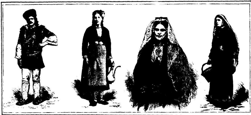
Le costume national.