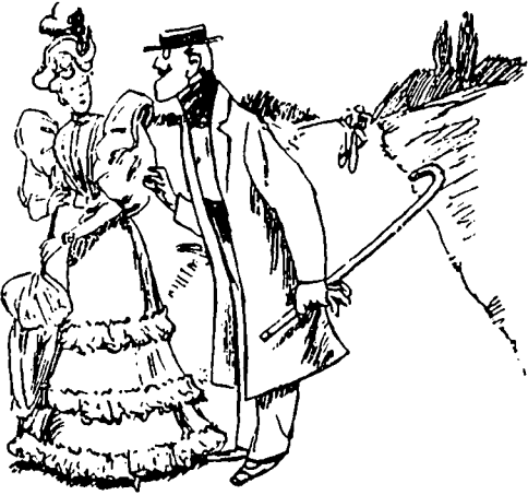
I Le jeune Mr Dude faisait des grâces autour de Mlle Lagomme, sur la route de Lachine.