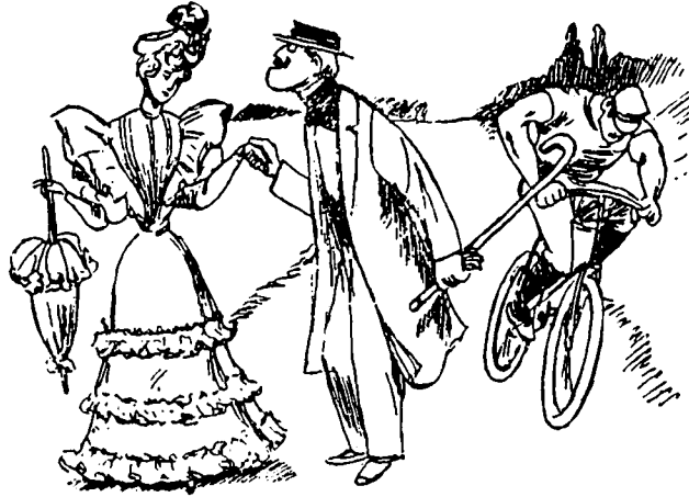
II La conversation devenait même extrêmement intéressante quand Dusport, le champion des cyclistes, vint à passer.