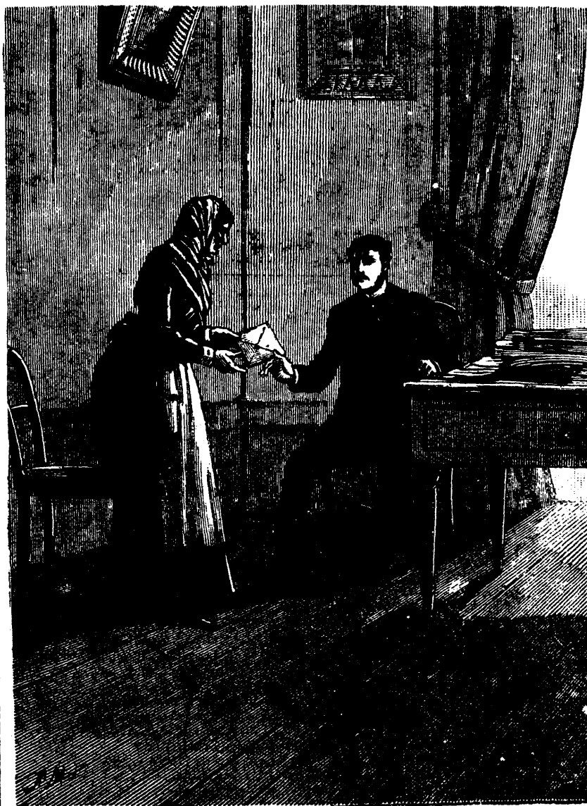
Voici ce que vous avez perdu, monsieur, dit Jeanne. (— Voir page 318, col. 1.)