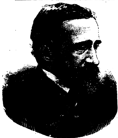
M. LE DR ZUKERTORT Actuellement engagé dans un tournoi d'échecs contre M. Steinitz