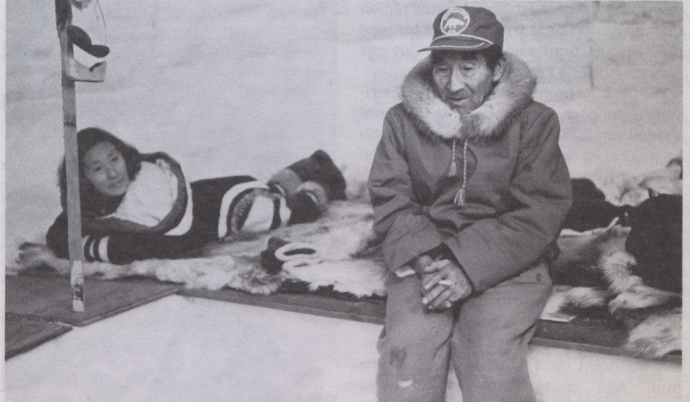
Debout sur leur terre, film du réalisateur Maurice Bulbulian.