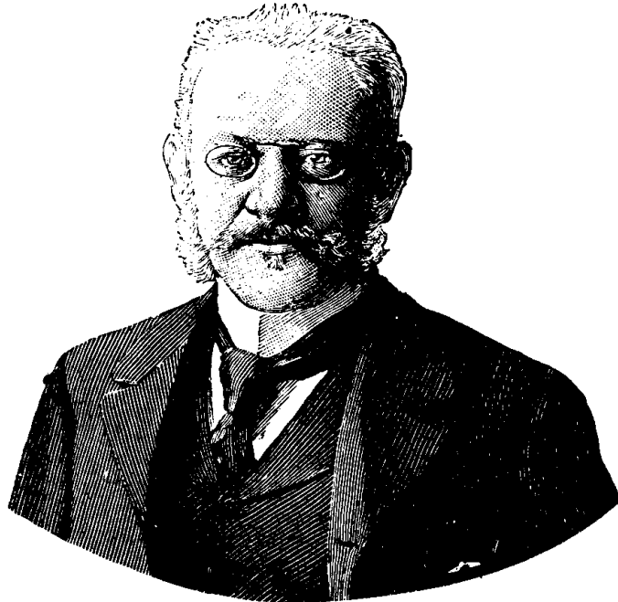
M. JULES CAMBON, ambassadeur français à Washington

La ligne, par insertion - - - 10 cents Insertions subséquentes - - - 5 cents Tarif spécial pour annonces à long terme