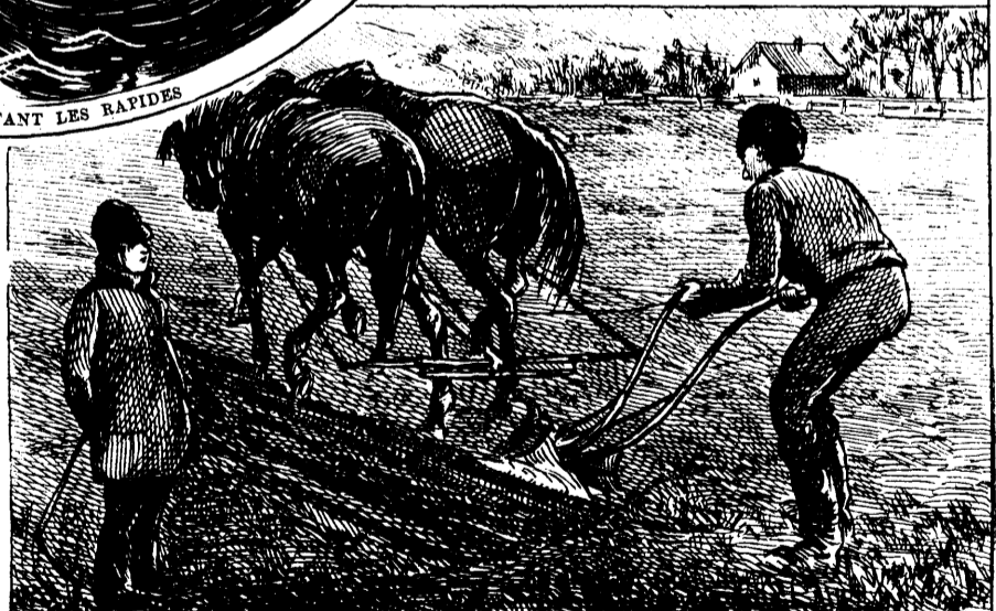
LABOUR A ST.-BRUNO