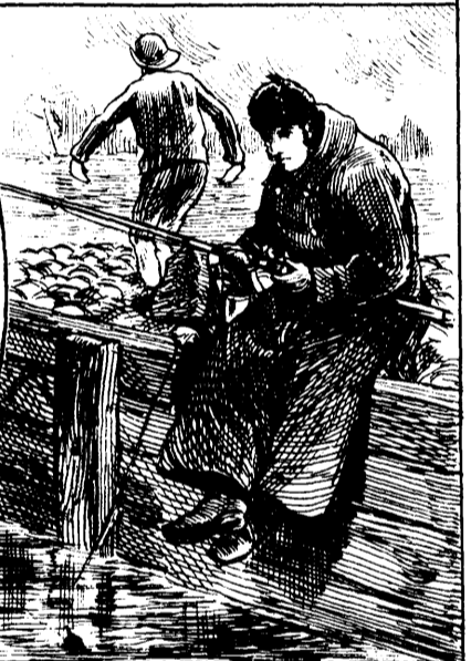
PÊCHE A LA LIGNE SUR LE QUAI RICHELIEU