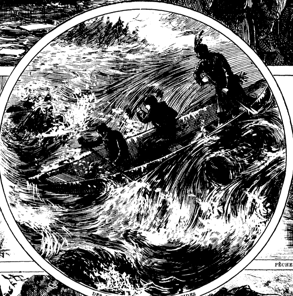
DES INDIENS SAUTANT LES RAPIDES