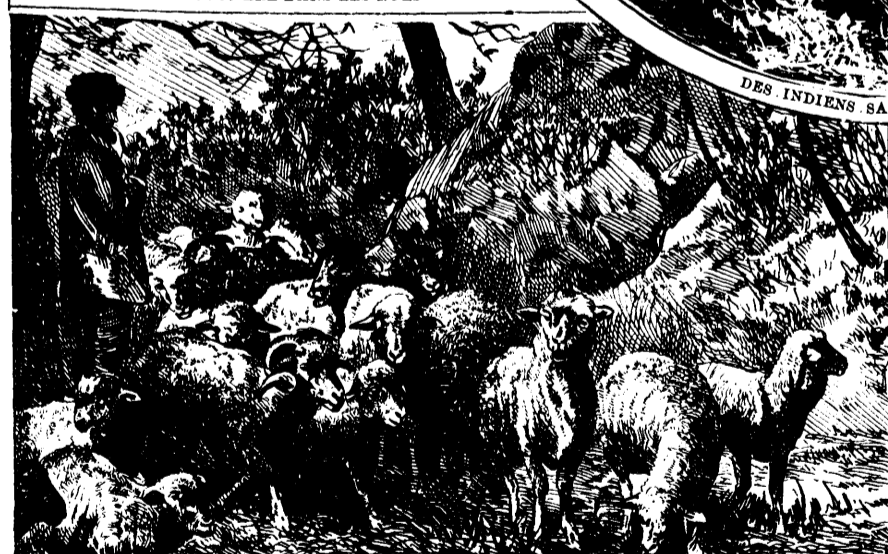
DES MOUTONS AU PATURAGE EN ARRIÈRE DE LA MONTAGNE