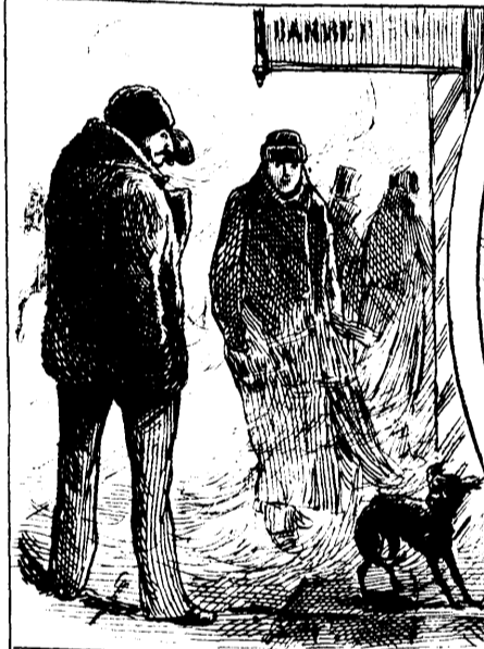
LA POUSSIÈRE DANS LES RUES