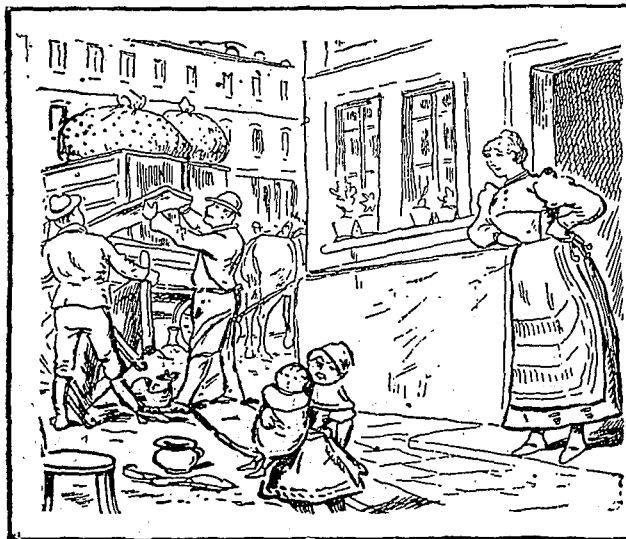
Un déménagement. Où est le propriétaire ?