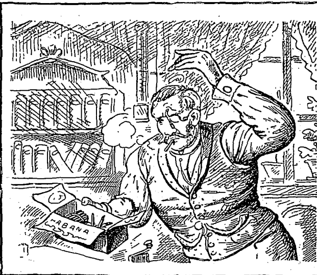
On lui fume ses cigares. Qui ça ?