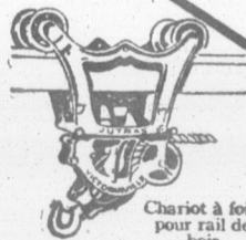
Chariot à foin pour rail de bois