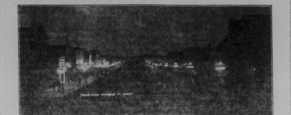
Main Street nattetid.