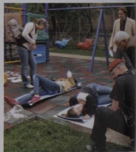
(à gauche) Pratique : Des participants à un cours sur la gestion des urgences dans une mission appliquent leurs connaissances du Système de commandement des interventions lors d'un exercice de simulation d'urgence. (au centre et à droite) Simulations de blessures à l'ambassade du Canada à Beijing

On constate déjà sur place les avantages réels de la formation et de la planification d'urgence. Par exemple, quelques mois après avoir participé à un exercice de simulation sur maquette dirigé par le Bureau régional de gestion des urgences, des employés de l'ambassade du Canada au Caire se sont rendus en Libye pour aider aux évacuations. Leur travail reflétait de toute évidence la structure du SCI, qui sert à gérer des urgences en établissant clairement un cadre de décision, de procédures et d'attribution des ressources.