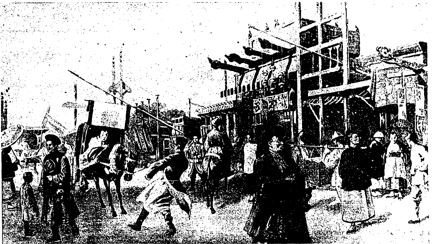
UNE RUE DE PÉKIN.