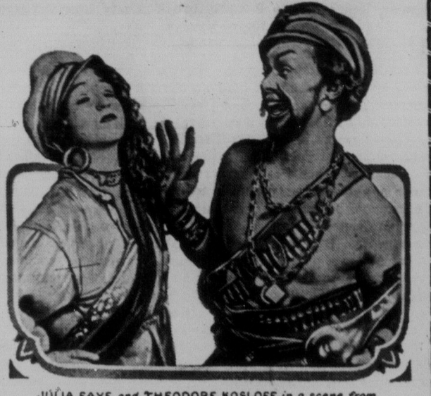
JULIA FAYE and THEODORE KOSLOFF in a scene from CECIL B. DE MILLE'S Production "THE VOLGA BOATMAN"

славна американська фільма відомого постановщика й директора Сесила Б. Де Мила п. н.