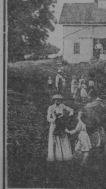
Der Deutsch-Canadische Hausfreund