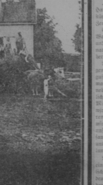
Der Deutsch-Canadische Hausfreund