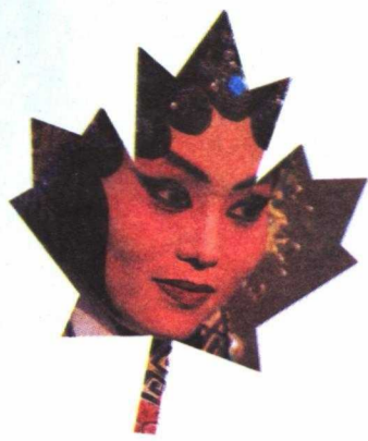
Vedette d'opéra cantonnaise