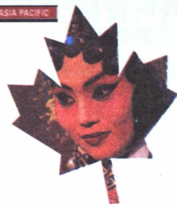
Vedette d'opéra cantonnaise