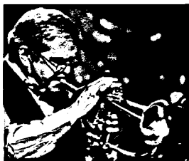
photo : Festival Jazz à Vienne

En faisant la tournée des vignobles autour de Vienne, arrêtez-vous au Heuriger de Grinzing et dégustez le cru local de l'année, accompagné du plat gastronomique qui lui convient. Les Heuriger, ou tavernes à vin, offrent un mélange de convivialité urbaine et d'ambiance viticole. Elles font autant partie des curiosités viennoises que la grande roue du Prater, le château de Schönbrunn, les Petits chanteurs de Vienne ou les étalons lipizzans.