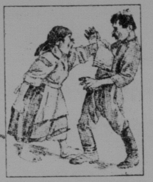
Явдоху обговорює з "міністром" державні справи.

Не тільки "Фа" і не тільки "Решпу-у-ублика", як її називає Архин, але ще й на колесах — "Риж його на лівю". Ех, яблочко, куди котиться? До "Республіки на колесах" в суботу, 16 листопада в Укр Ріб Домі — "Хрест на мени". Це така республіка, якої ні в світі не бачив. Про це вам скаже і салдатка Явдоху, яка президентові самотону не може наставить. А попова Фенька каже: "Геть вийовичі горшки та миски, хай живе анархія — матір порідку!" Ох, як вона ненавидить паскудне мішанство!