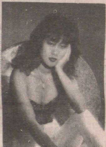
台灣青春美艷紅歌星 倪娟娟小姐